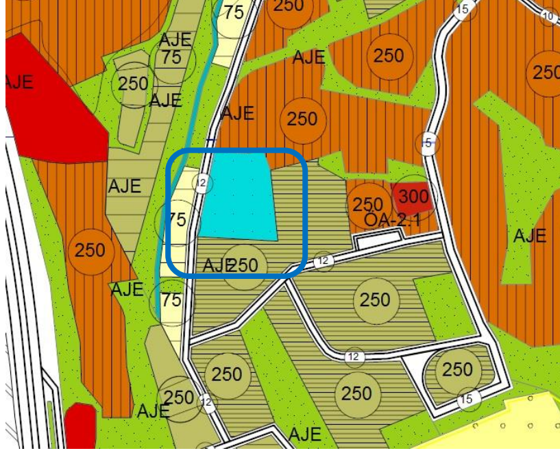
Yürürlükteki Mudanya 1/5000 Ölçekli Nazım İmar Planı Örneği