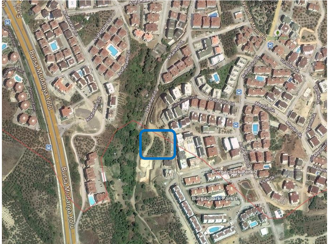
Şekil 1 Planlama Alanının Uydu Görüntüsündeki Yeri

Plan değişikliği talebine konu taşınmaz Bursa İli, Mudanya İlçesi, Burgaz Mahallesi sınırlarında, 2. Sanayi Caddesi üzerinde, Bursa-Mudanya Yolu'na 213 m, Bursa Feribot İskelesi'ne 835 m mesafede konumlanmıştır.